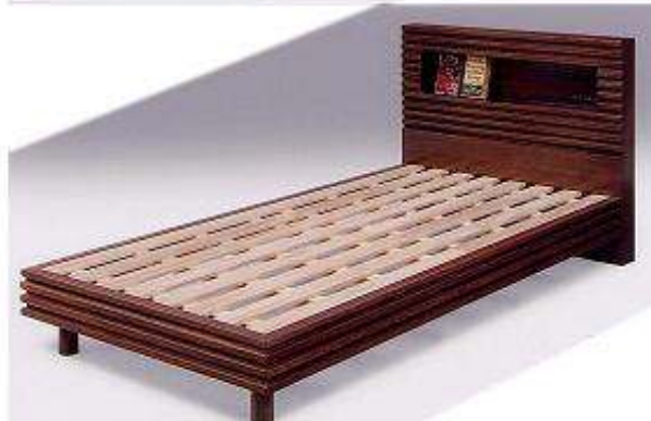
穏やかなナチュラル色